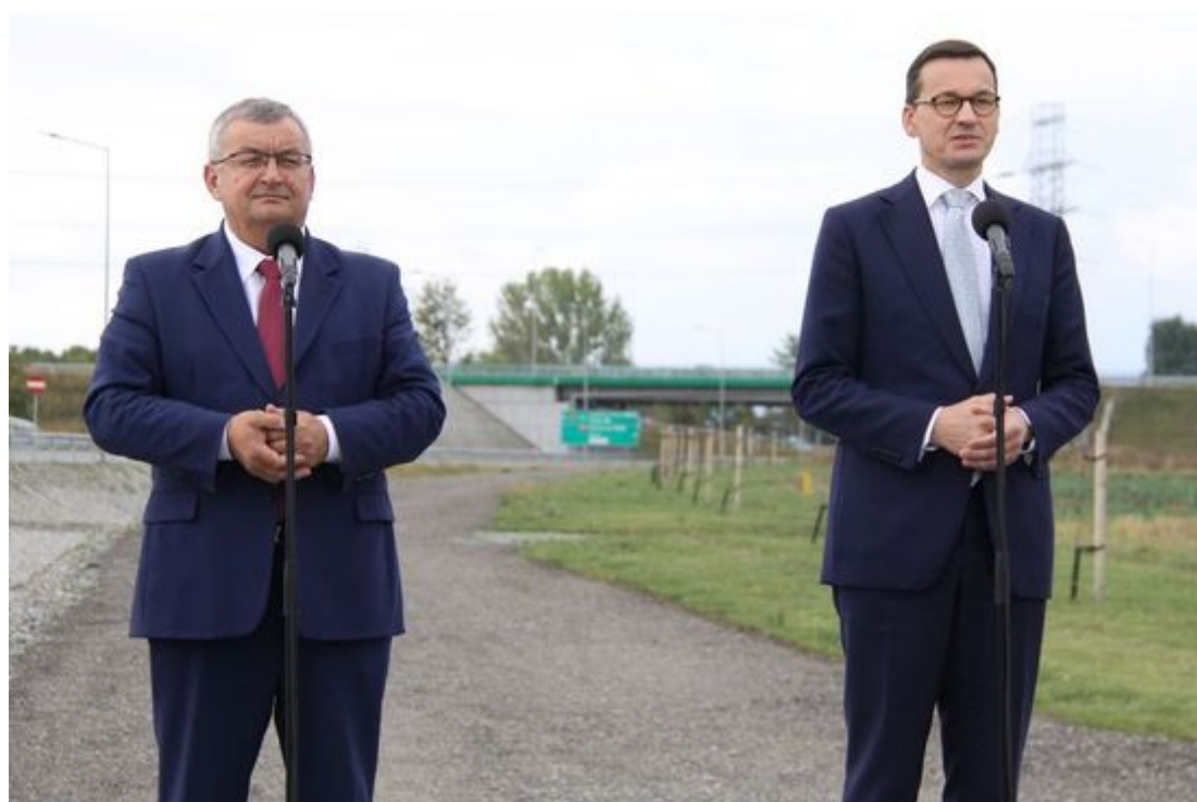
Premier i minister zapowiedzieli budowę S8 z Kłodzka do Wrocławia